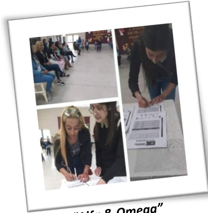
“Alfa & Omega” “Mujeres del Sur”