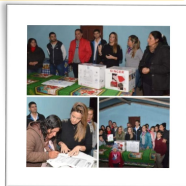
"MN Creaciones" LOMAS SUR