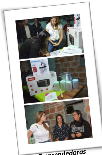
Emprendedoras Merendero LOMAS SUR