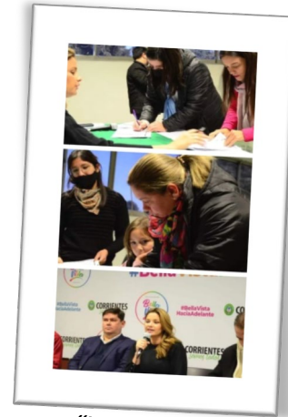
“Lavadíissima” “Abrazame Fuerte” “Diseñando nuestro Futuro”