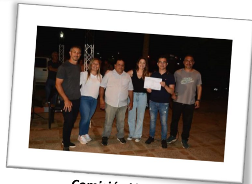
Comisión Vecinal B° Santa Lucía